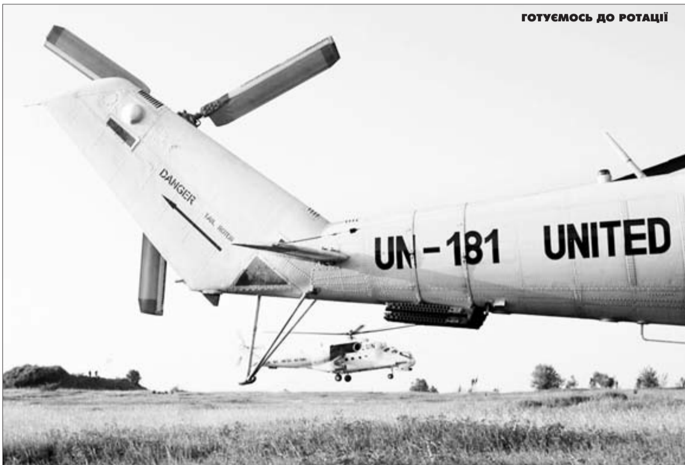
ГОТУЄМОСЬ ДО РОТАЦІЇ

24-25 травня на території Міжнародного центру миротворчості та безпеки, що на Львівщині, відбулося бойове застосування вертольотів Мі-24 із бойовими пусками некерованих ракет та стрільбами з кулеметно-гарматного озброєння. Його проводили авіатори 56-го окремого вертоліт-